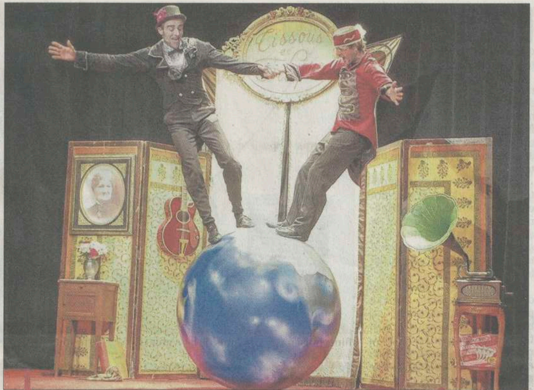
"L'avenir c'était mieux avant" est un spectacle déambulatoire mêlant musique, jongleries, improvisation et humour. Rendez-vous ce soir, à 18 h, au parc Arnaud de Corbières.

En réalité, ils naquirent doucement, puisque les toutes pre-